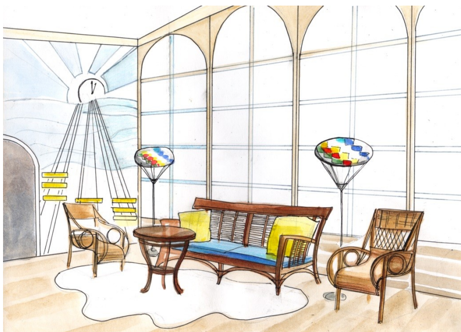
Рис. 5. Оформление интерьера на основе предложенной образной концепции. Пример студенческой работы.