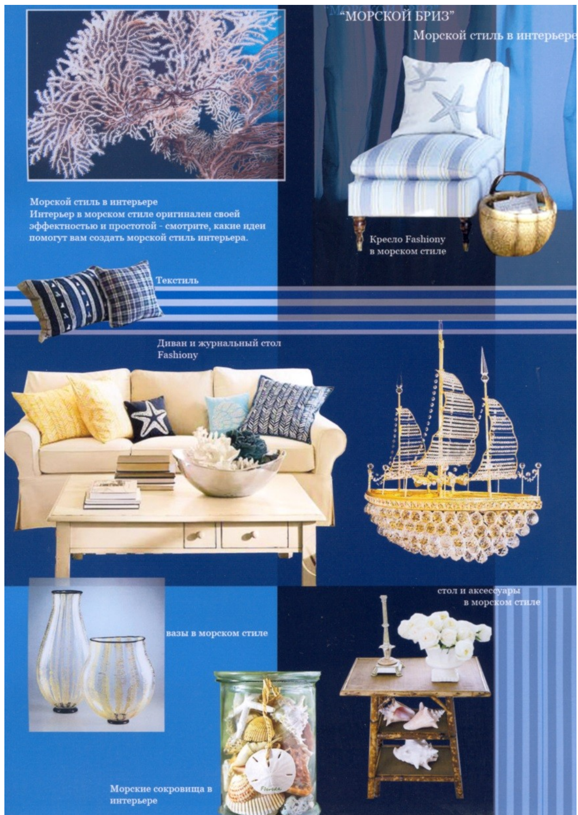
Рис. 7. Стилевой коллаж с подбором аксессуаров и деталей, завершающих создание целостного образа интерьера. Пример студенческой работы.

Иллюстрации имеют сквозную нумерацию. При ссылках на иллюстрации в тексте следует писать, например: "в соответствии с