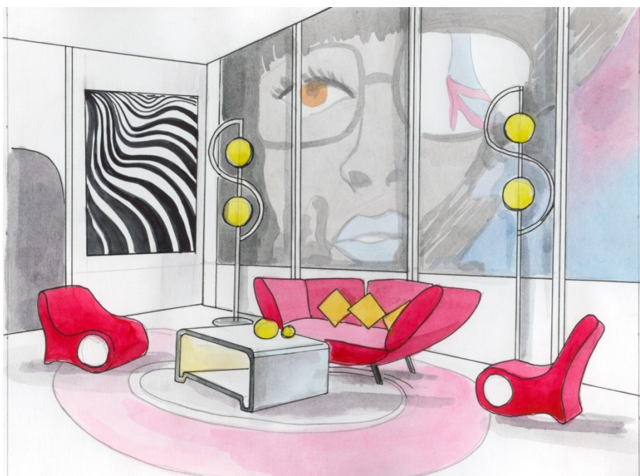
Рис. 3. Оформление интерьера в одном из современных стилей. Пример студенческой работы.