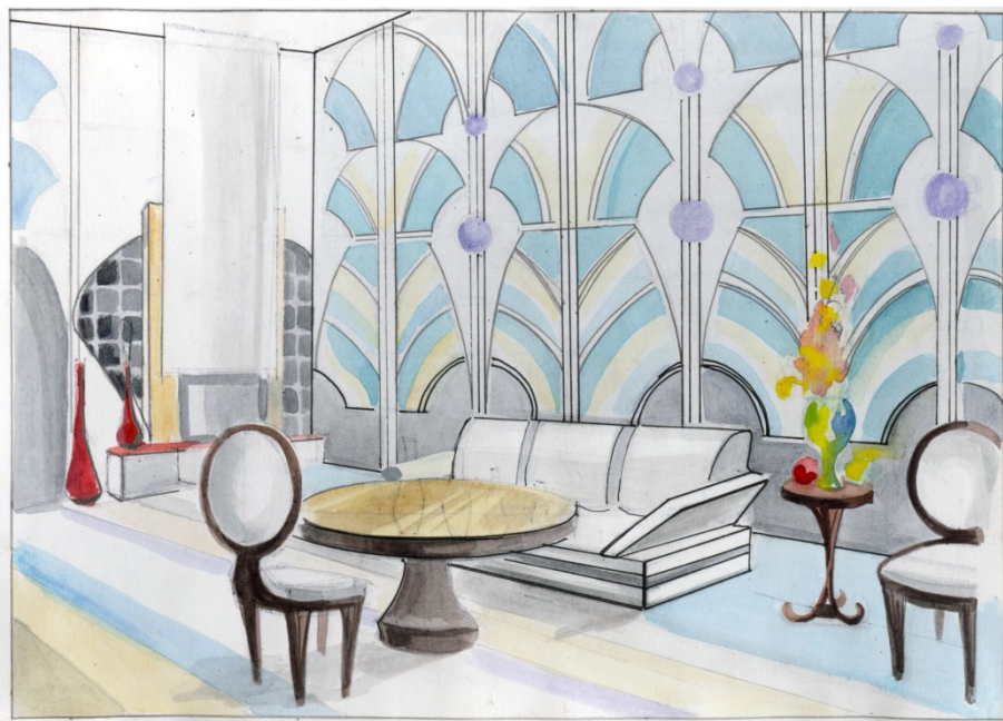
Рис. 2. Использование приемов стилизации одного из исторических стилей. Пример студенческой работы.