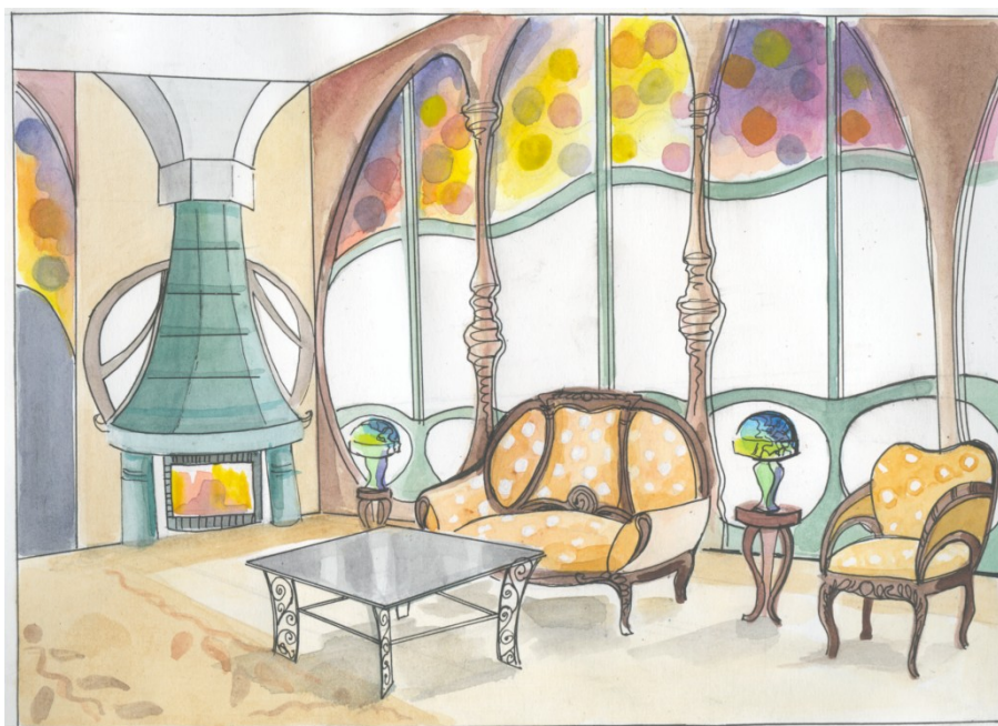
Рис. 1. Использование приемов стилизации одного из исторических стилей. Пример студенческой работы.