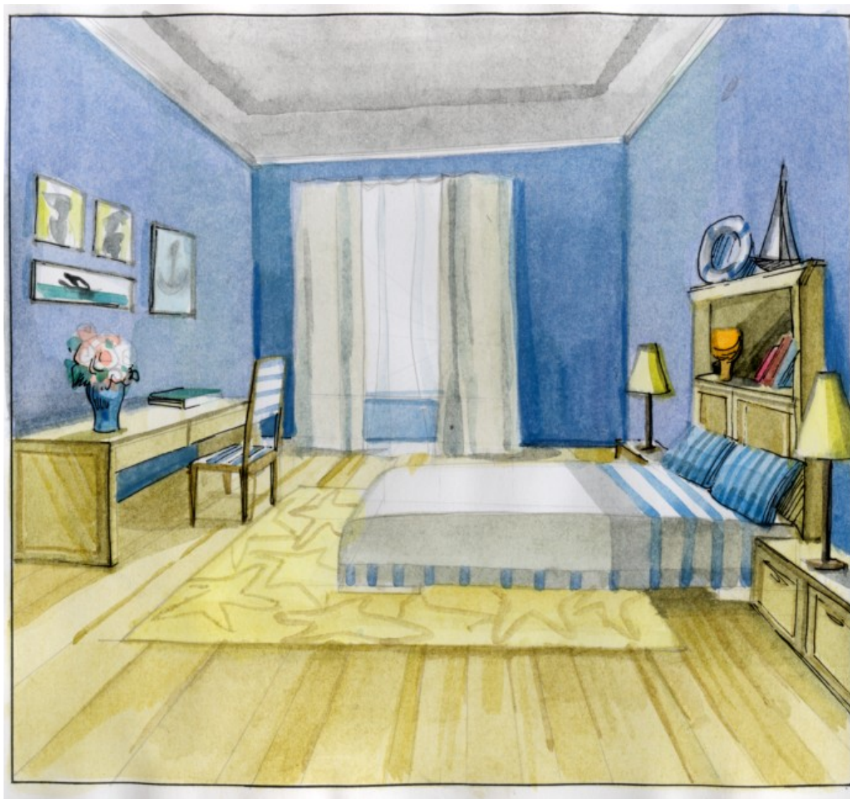
Рис. 6. Оформление интерьера на основе предложенной образной концепции. Пример студенческой работы.